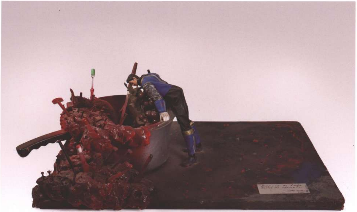
Removiendo cabezas , materiales diversos, 2011