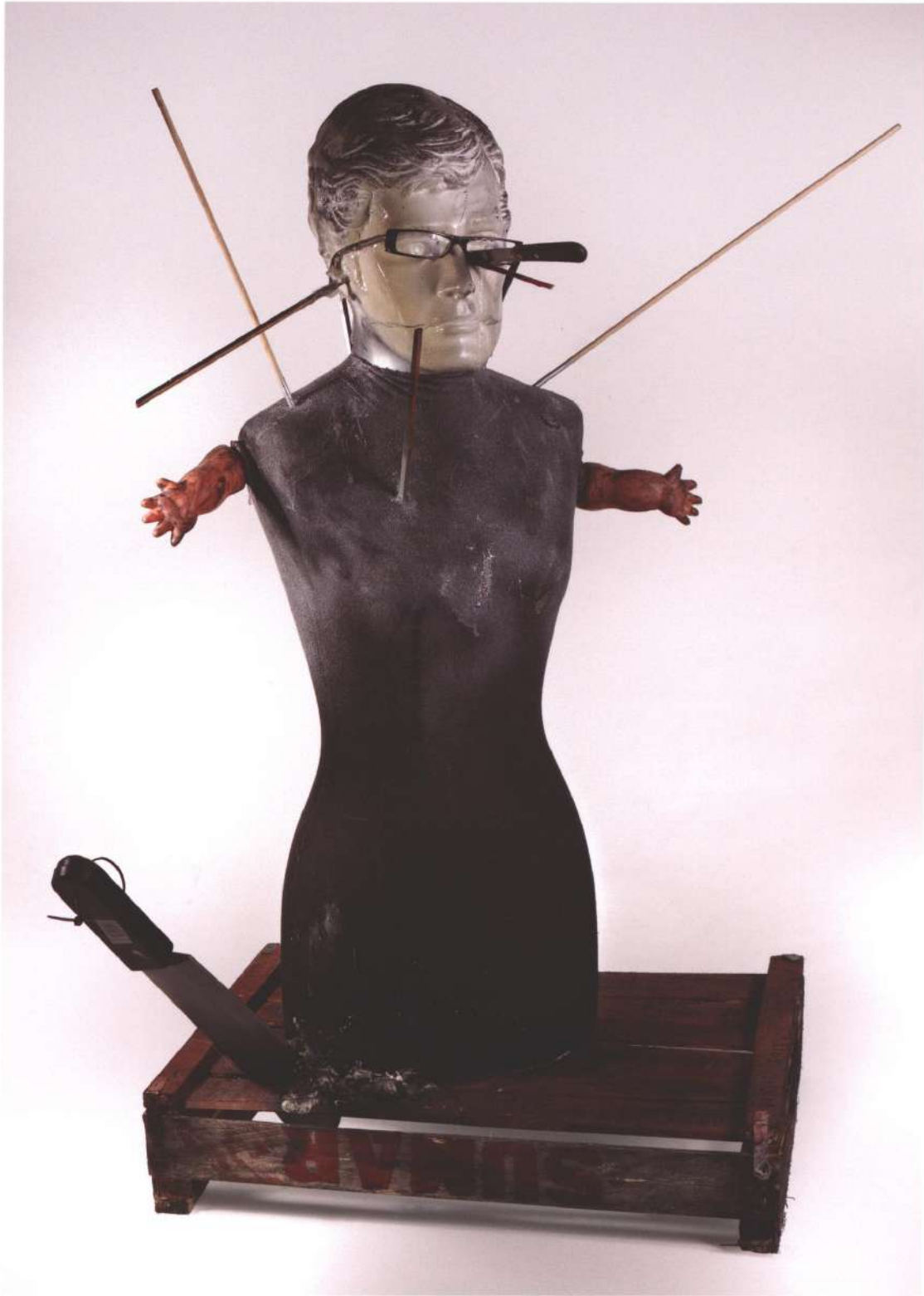
Sin salida , materiales diversos, 2012

pág. 19 > Todavía sirve , materiales diversos, 2012