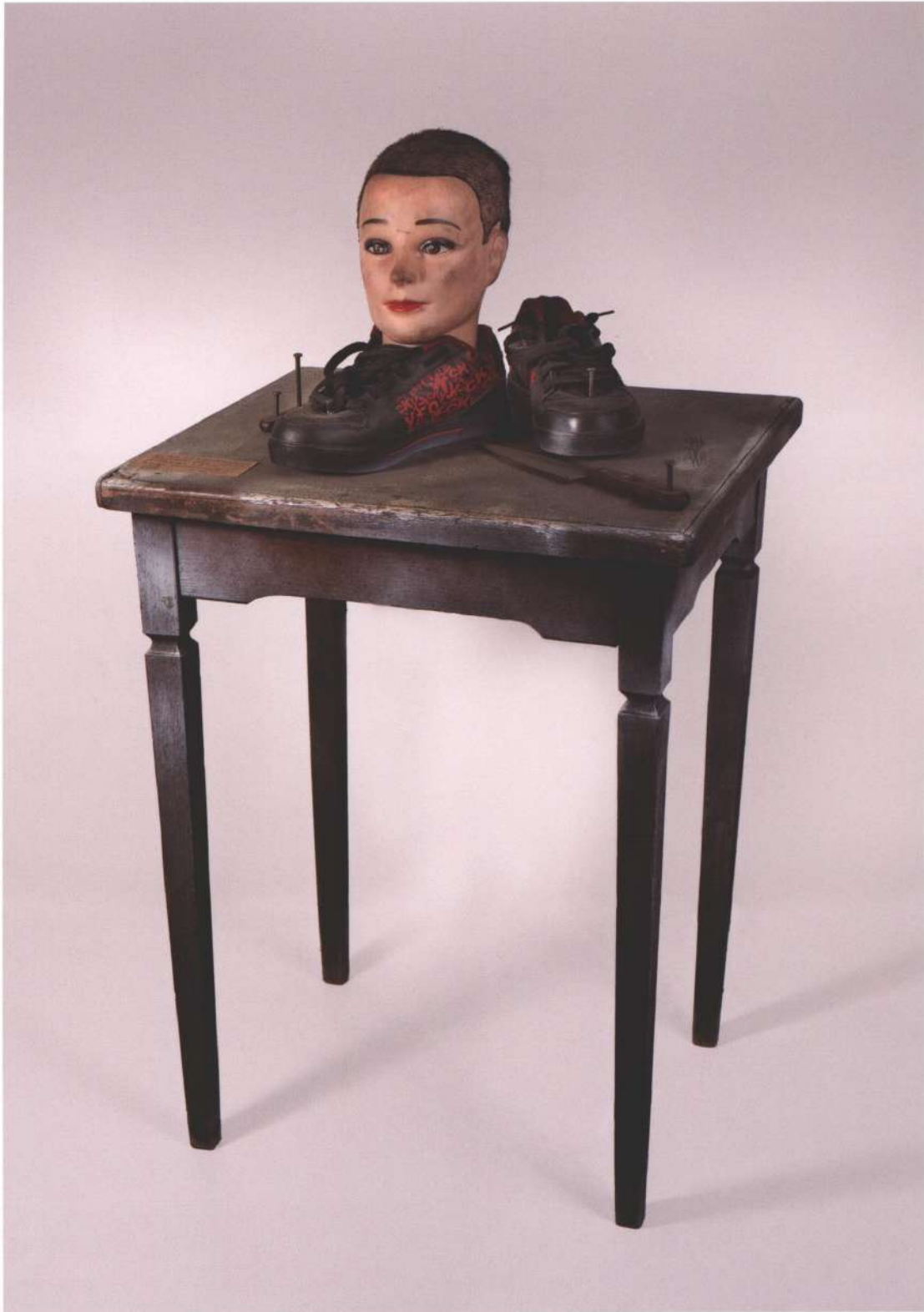
Cerebro actual , materiales diversos, 2010

pág. 15 > Desde chico que nos oprimen , materiales diversos, 2010