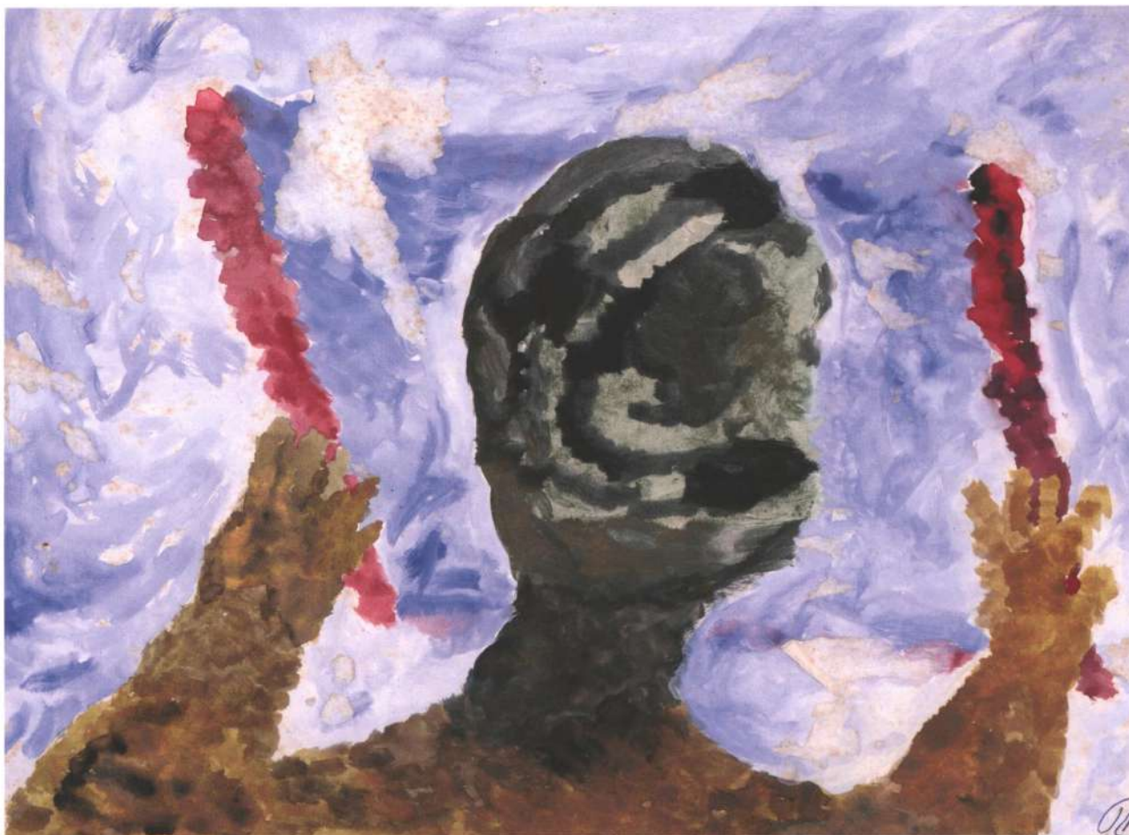
RAFAEL GIROLA ¿Que lees? , técnica mixta sobre papel, 31.5 x 43.5cm, 1987