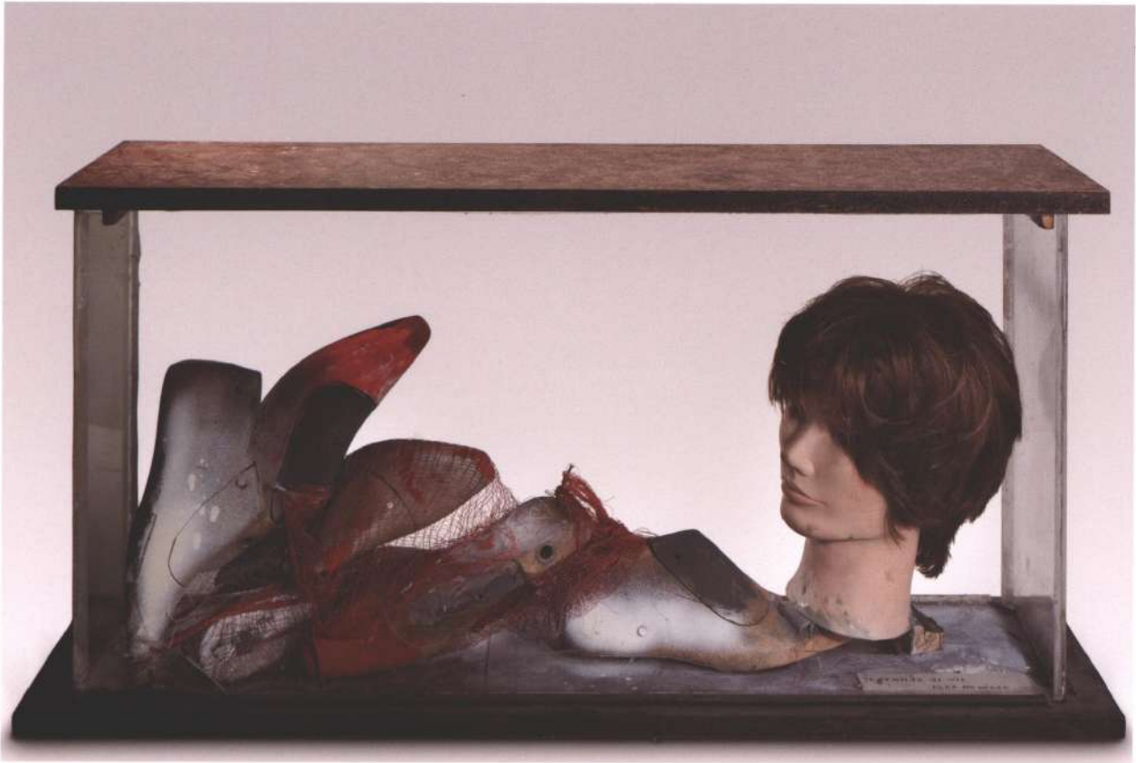
Diversidad del cuerpo , materiales diversos, 2012