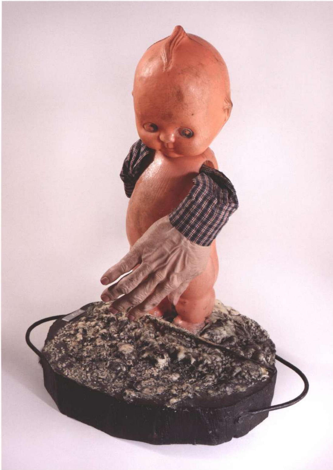
Se le fue la mano , materiales diversos, 2012

pág. 15 > El desgaste , materiales diversos, 2012